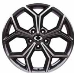
18 colos "Diamond Cutting" könnyűfém felni 235/55R gumikkal